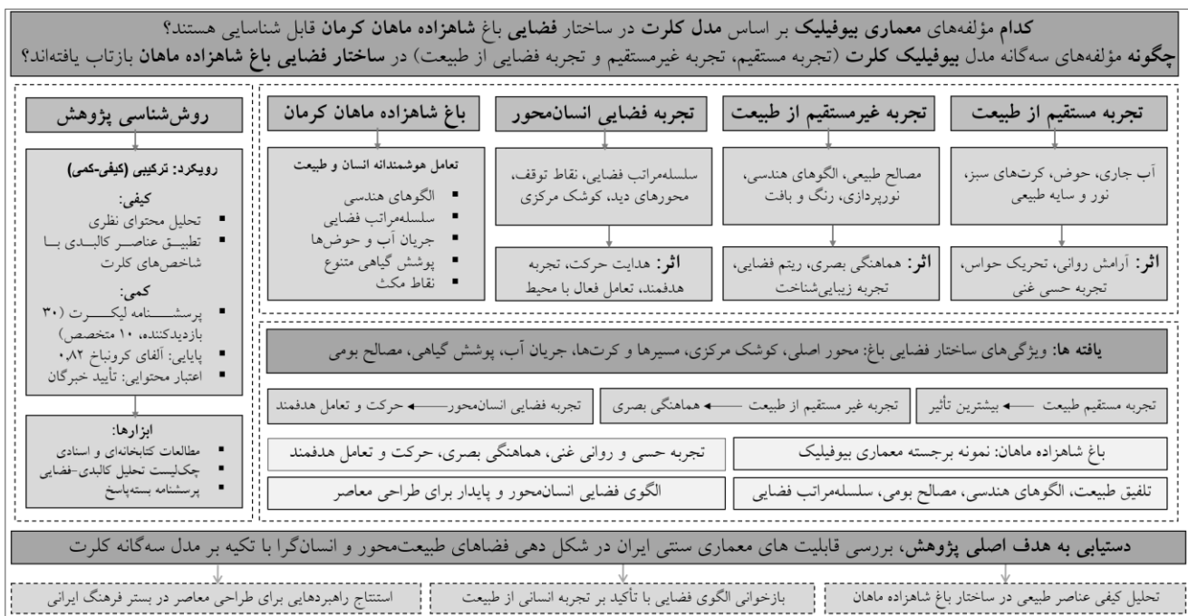
شکل ۲: چارچوب مفهومی پژوهش

طراحی ترکیبی (کیفی-کمی) پژوهش حاضر، امکان برقراری ارتباط میان تحلیل کالبدی-فضایی باغ و تجربه ادراکی انسان از محیط طبیعی را فراهم می‌سازد؛ امری که مستقیماً با اهداف پژوهش مبنی بر «شناسایی مؤلفه‌های بیوفیلیک در ساختار فضایی باغ شاهزاده ماهان» و «تحلیل نحوه بازتاب تجربه‌های سه‌گانه کلرت در فضای باغ» هم‌راستا است. در واقع، داده‌های کیفی چارچوب مفهومی لازم برای تفسیر کالبدی را ایجاد می‌کنند و یافته‌های کمی میزان حضور و درک این مؤلفه‌ها را از دیدگاه کاربران و متخصصان ارزیابی می‌نمایند. با وجود طراحی دقیق روش تحقیق، پژوهش حاضر با محدودیت‌هایی همراه بود. نخست، دشواری در کمی‌سازی ادراکات