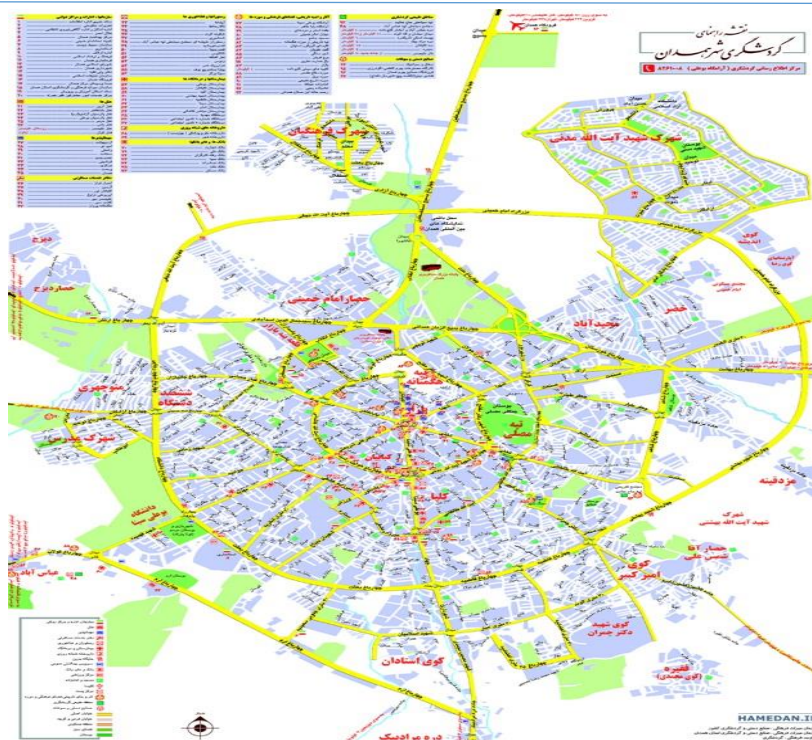
شکل ۲. نقشه گردشگری شهر همدان (اداره کل میراث فرهنگی، صنایع دستی و گردشگری استان همدان، ۱۳۹۷)